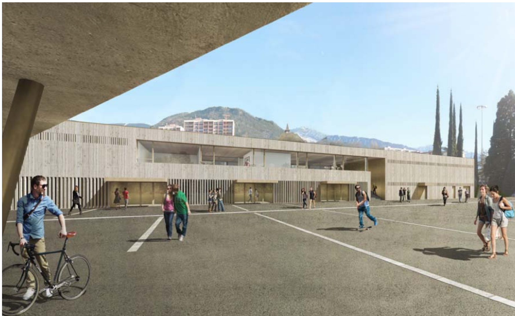
Vue du bâtiment depuis le parvis