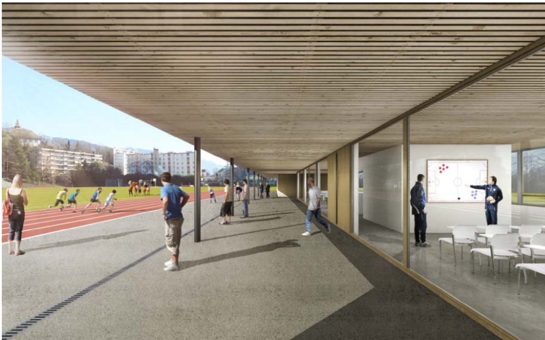
Vue du bâtiment depuis le stade d'athlétisme